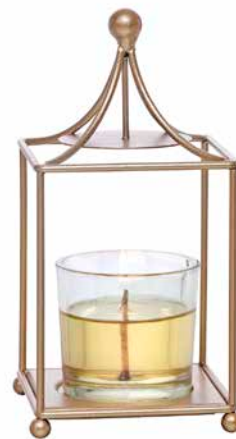
Votivkerzenhalter Champagner-Laterne Metall. Inkl. Klarglas für Votivkerzen und Teelichter. H: 15 cm, B: 8 cm P93013 29,90 € 11,96 €