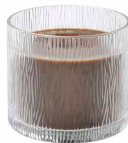
Nature's Light by PartyLite Duftwachsglas Kokos-Teakholz G461040E 42,95€ 25,77 €