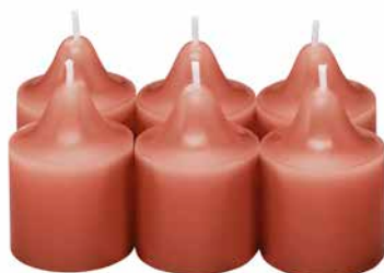
Duftvotivkerzen Scharlachrote Sonnenblume, 6 St. V061013E 10,45€ 6,27 €