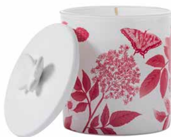
Duftwachsglas Frühlingszeit Himbeer-Rhabarber G961031E 19,95€ 11,97 €