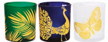
Teelichthalter Exotischer Garten, Trio Glas. H: 8 cm, B: 7 cm. P93431 34,95 € 13,98 €