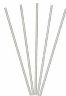
Smartscents Dekorative Duftsticks Vanille Kokosnuss, 5 St. FS929E 22,95€ 13,77 €