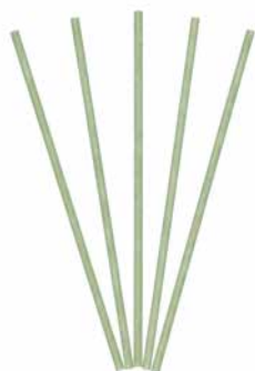
Smartscents Dekorative Duftsticks Weißer Flieder & Efeu, 5 St. FS1029E 22,95€ 13,77 €