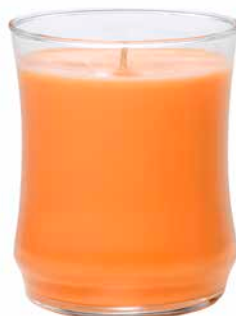
Duftwachsglas Essential Magische Mango G451038E 19,95€ 11,97 €