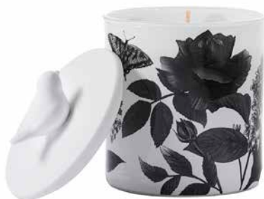
Duftwachsglas Frühlingszeit Weißer Flieder & Efeu G961029E 19,95€ 11,97 €