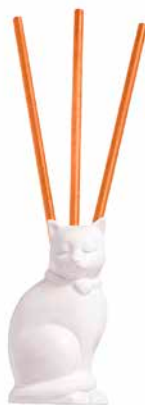
SmartScents by PartyLite™ Halter Kitty Keramik. H: 11 cm, B: 6 cm. P93456 14,95 € 5,98 €