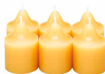
Duftvotivkerzen Ananas-Zuckerrohr, 6 St. V06926E 10,45€ 6,27 €