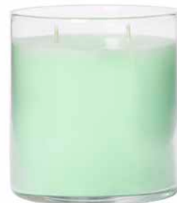
GloLite by PartyLite Duftwachsglas Zitronella-Minze G26B1093E 32,95€ 19,77 €