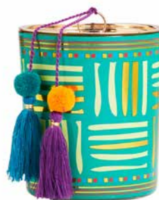
Duftwachsglas Borderless Brights™ Exotisches Hinoki-Holz G591091E 34,95€ 20,97 €