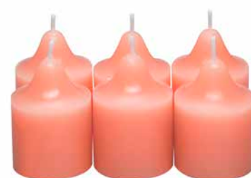
Duftvotivkerzen Fresh Home Tropische Brise, 6 St. V06B1011E 10,45€ 6,27 €