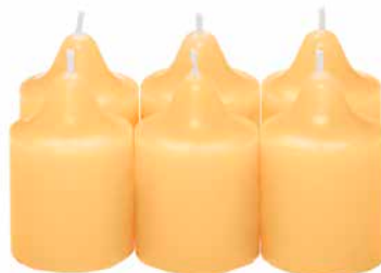
Duftvotivkerzen Mango-Mandarine, 6 St. V06154 10,45€ 6,27 €