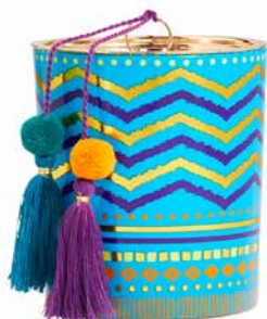
Duftwachsglas Borderless Brights™ Ingwer-Safran G591090E 34,95€ 20,97 €