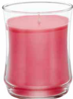
Duftwachsglas Essential Bellini G451018E 19,95€ 11,97 €