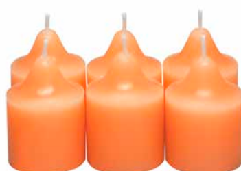
Duftvotivkerzen Magische Mango, 6 St. V061038 10,45€ 6,27 €