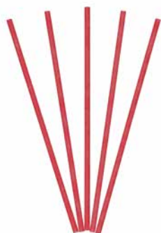
Smartscents Dekorative Duftsticks Himbeer-Rhabarber, 5 St. FS1031E 22,95€ 13,77 €